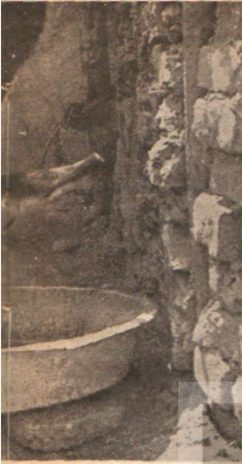
İnsanları yalayan bir ezelek.

suz gecekondular. Kömür Tevzii Kurumunun işçileri oturuyordu bu gecekonduların çoğunda. Çevredeki beş yüz gecekonduda üç bin beş yüz kişi yaşıyordu. Kuruçesme sirtlarında gecekondularda oturanlarla Beykoz sirtlarında oturanların su derterleri arasında bir ayırım, bir başka düzen yoktu. Buralarda su bulmak güçtü. Buralarda da kadınlar çeşme başlarında tükeniyorlardı. İki üç kilometre ötelelerdeki çeşmelerden su getiriyordu gecekondulu sakinleri. Günün büyük bir bölümünde çocuk su taşıyordu.