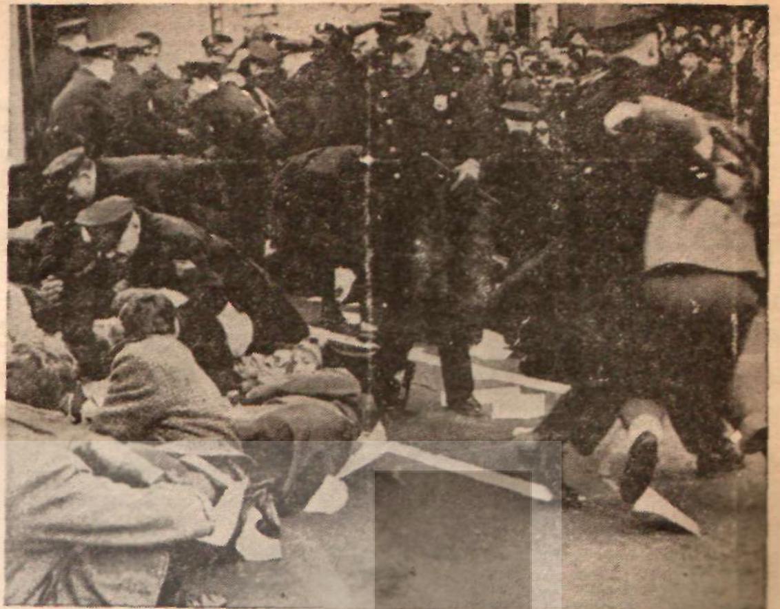
Amerika'da atom silâhları aleyhinde bir gösteri

Duruşma sonunda sanıklar çıkarken, kapı önünde toplanan 100 kadar insan sanıkları alkışladı ve «Yaşayın kahramanlar» diye bağırdı. Sıkı emniyet tedbirleri alındığı için bir hâdisce olmadı.