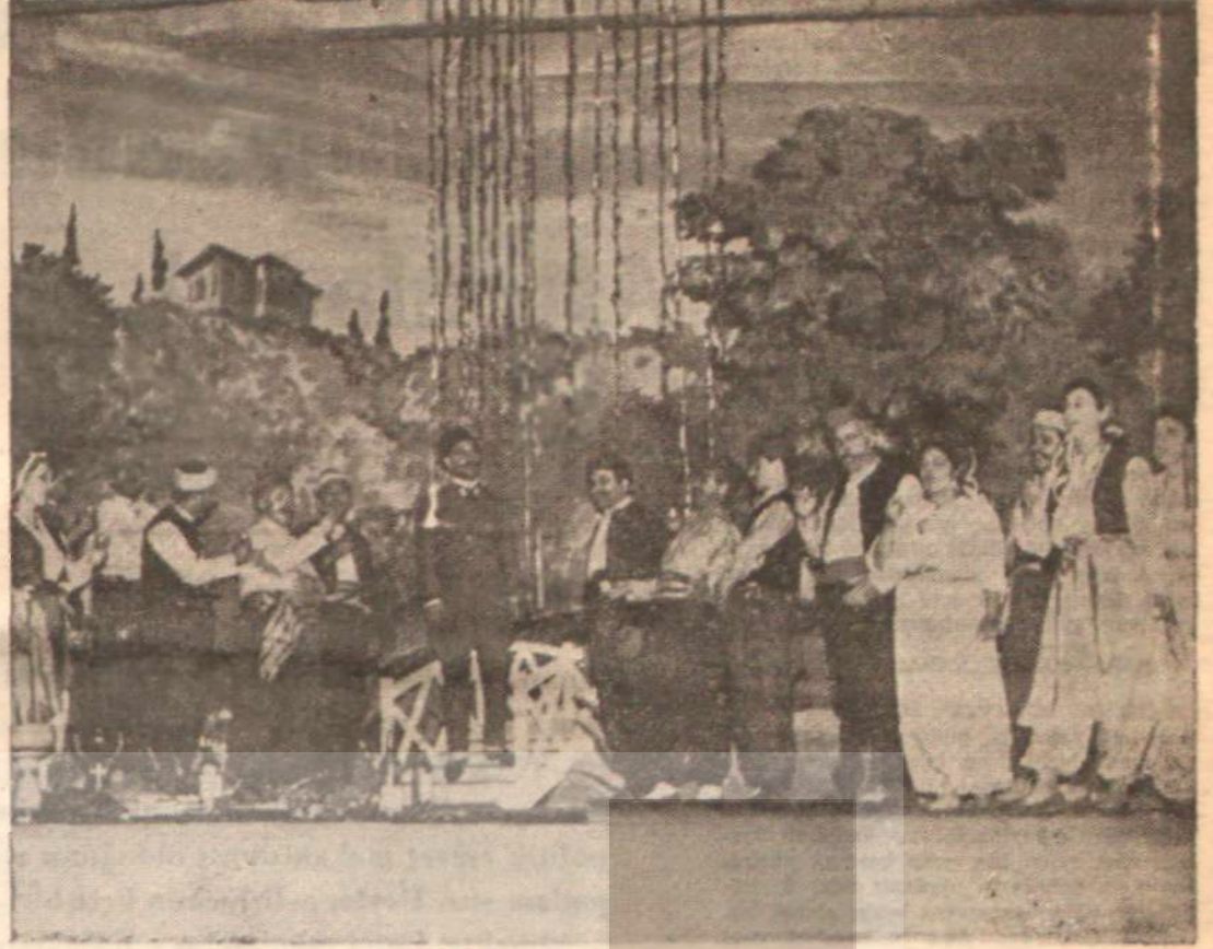
«Leblebici Horhor» operetinden bir sahne.

Leblebici Horhor operetinin başarısızlık nedenlerini sayarken