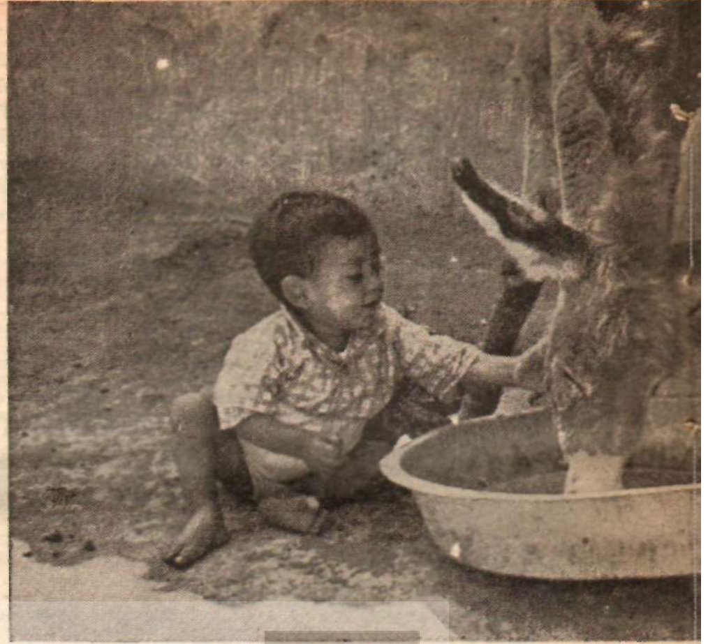
Gecekondularda eşekler de susuzdur. Leğenin dibinde kalan su damla