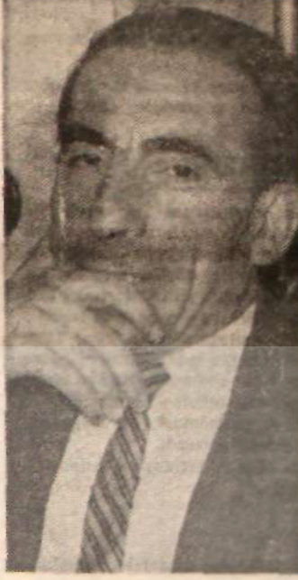
Alparslan Türkeş «Ben bu yola...»

da kalması psikolojik bir hata olmuştur. 27 Mayıs Anayasasına kırmızı oy veren AP'lerin oylarını alma çabasındaki Türkes'in, AP'yi 27 Mayıs liderine şikâyetli de en azından çelişik bir tutum- dur. Görülüyor ki CKMP kongresi, eğer yapılabilsen büyük bir kargaşalık içinde başlayacaktır ve bu durum kongrenin sonucu ne olursa olsun, CKMP'nin se- çim şansını, herhalde arttırmıya- caktır.