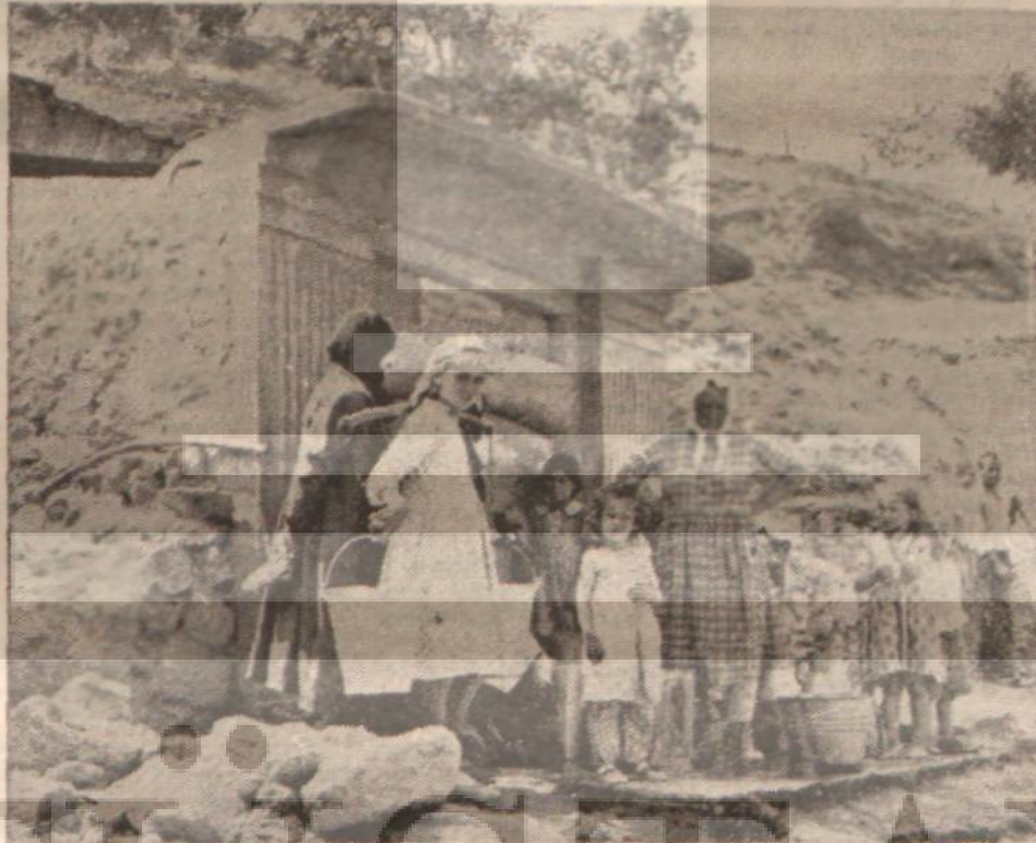
Fırıncının sahip çıktığı çeşmenin başında kadınlar.

«Susuzluk çok büyük dert bey. İlle de susuzluk. Hani buralara gecekondulu kurmazdan önce bizlere susuzluğu haber ettiler. Ama o zaman susuzluğu kim düşünür. Sokakta kalmışız. Akşamdan akşama da olsa başımızı sokacak bir yer lazım dedik. Sokakta kalmak, tansa kurdük gecekonduyu. Ama susuzluk hiç bir şeye benzemez. Burası suyun en pahalı olduğu yerdir, kardeş. Suyun etekesini gün gelir elli kuruşa, gün gelir yetmiş beşe alırız. Bir saka bulduk. Sen bize su taşı dedik. Adam bir süre taşıdı. Sonra korumuyor, latırın yem parası zor çıkıyor dedi, tenekesini elli kuruşa çıkardı. O da canı istediği gün getirir, istemediği gün getirmez. Keyfi bilir. Keyfine kalmış. Sakının yolunu gözleriz. Gelir. Yetmiş beş kuruş.. İstersen dökeyim istersen dökmeyim, der. Biz suyu suyaad karşıda Ayvalık dedikleri bir yer var kimi oradan, kimi Ulus Yapı Kooperatifinden, kimi Amerikan Kolejinde kaçak alırız. Bu dediğin yerler de en az iki kilometre ötede. Susuzluk canımızın çekirdeğine dek yaktı, kavurdu bizi.»