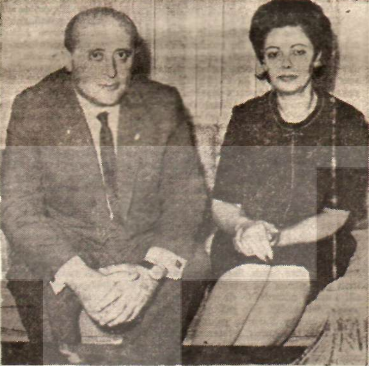
Süleyman Demirel ve eşi

Gene soruyorum: Yakın geleceğin başbakanı olup tepemize oturması için Demirel ne gibi bir imtihan vermiştir? Hangi krizi çözmüştür? Hangi mücadeleyi yapmıştır?... Bir insan için «şu işi vavap vavamaz» demek için, zecimisteki keraatına bakılır!.. Demirel'in böyle bir